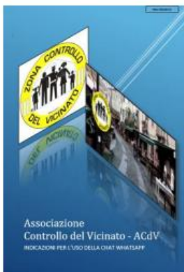
INDICAZIONI PER L'USO DELLA CHAT WHATSAPP