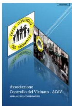
MANUALE DEL COORDINATORE