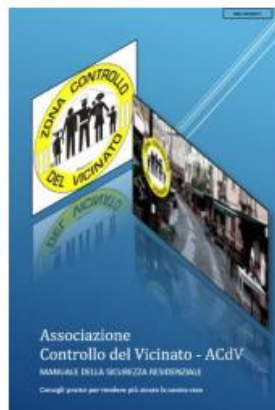
MANUALE DELLA SICUREZZA RESIDENZIALE