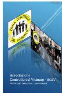
PROTOCOLLO OPERATIVO LA FOTOGRAFIA