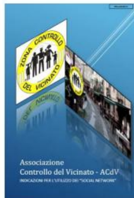
INDICAZIONI PER L'UTILIZZO DEI "SOCIAL NETWORK"