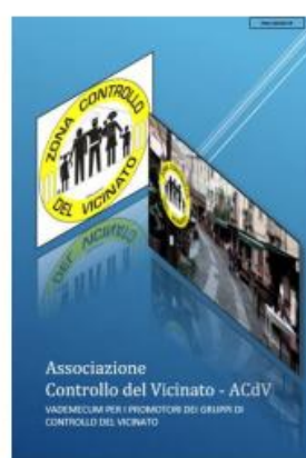
VADEMECUM PER I PROMOTORI DEI GRUPPI DI CONTROLLO DEL VICINATO